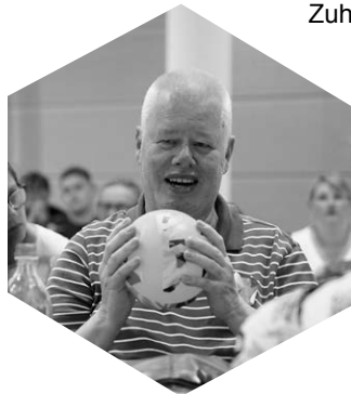
...auf der SeBi-Tagung