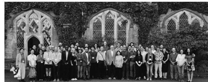
ENOJP Konferenz in Cork, Irland.