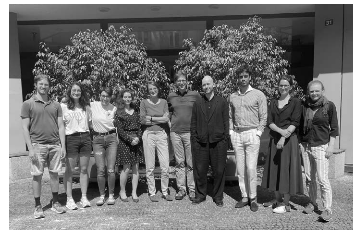
Das Team des ZGFs im Juli 2023