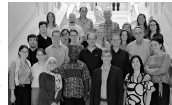
Christian-Muslim Dialogue in Bilbao